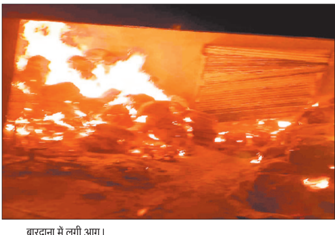
बारदाना में लगी आग।