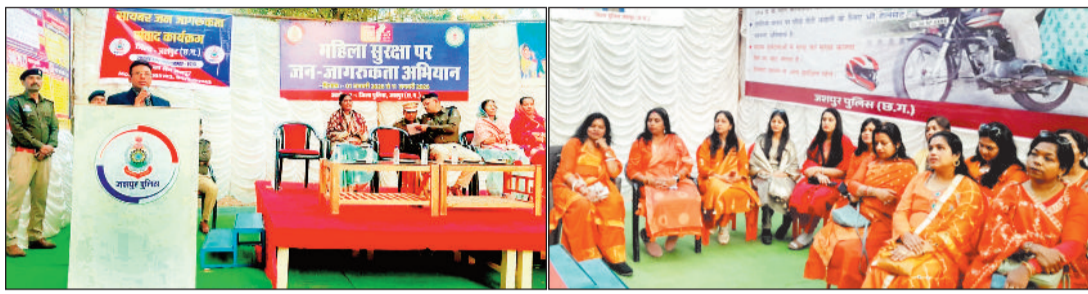
हरिभूमि न्यूज | जशापुरनगर

तेज रफ्तार और लापरवाही से बढ़ती सड़क दुर्घटनाओं पर अंकुश लगाने के लिए जशापुर में एक अनोखी पहल देखने को मिली। कम्युनिटी पुलिसिंग के तहत सजल ग्रुप महिला समूह की महिलाएं सड़क पर उतरतीं और वाहन चालकों को सख्ती नहीं, बल्कि संवेदनशील तरीके से यातायात नियमों का महत्व समझाया।