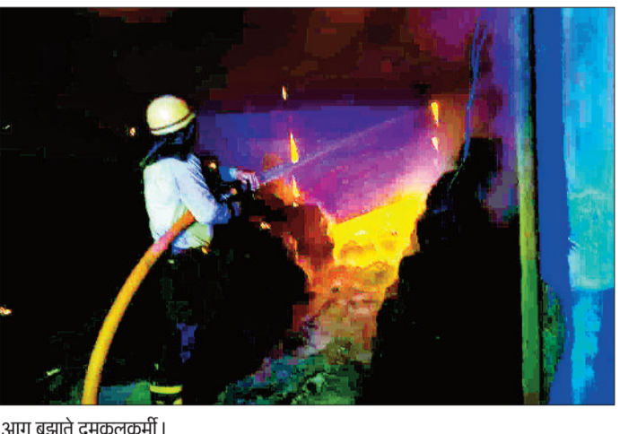
आग बुझाते दमकलकर्मी।