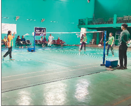
अपनी खेल का प्रदर्शन करती महिला खिलाड़ी।